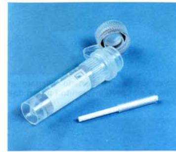
1 tampone assorbente 1 contenitore per il tampone assorbente