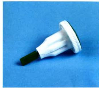
1 ago monouso